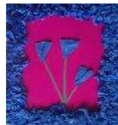
Фот.2. – «Для любимой мамочки»