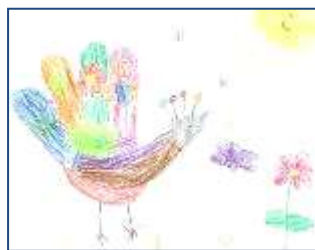
Фот.1. «Сказочная птица»

В своей работе часто использую нетрадиционные техники изобразительной деятельности: печатание штампами, листьями, рисование пальчиками, ладошкой, коллаж, украшение объекта с помощью фантиков, лоскутков, смятых салфеток, создание объёмных картин из пластилина, природных материалов [фото1, 2].