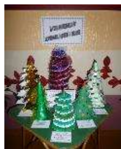
Фот.5. – оригами «Ёлочка» Фот.6. – «Хоровод ёлочек»

Приобщение родителей, их внимание к занятию своего ребенка придаёт детям уверенность в своих способностях и возможностях, содействует развитию творческих проявлений.