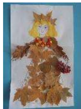
Фот.3. – коллективная работа